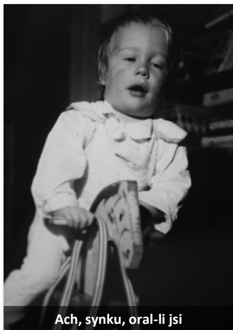
Ach, synku, oral-li jsi