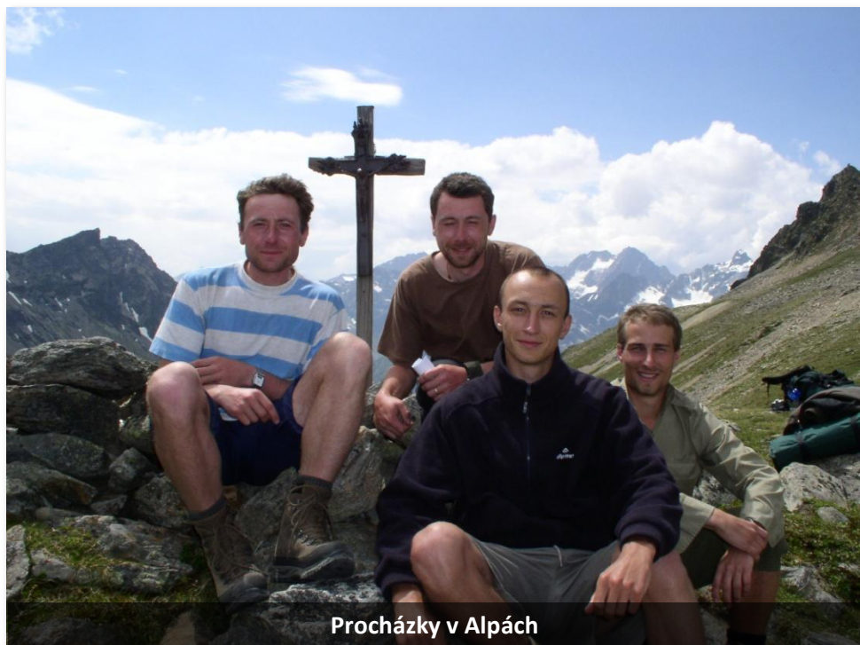
Procházky v Alpách