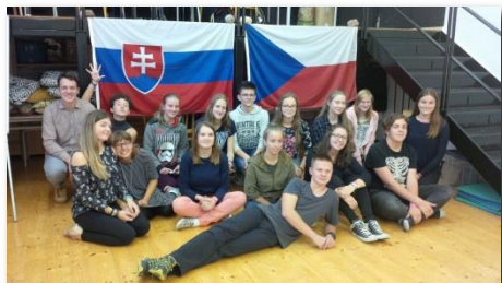
Studenti G6 a PL2